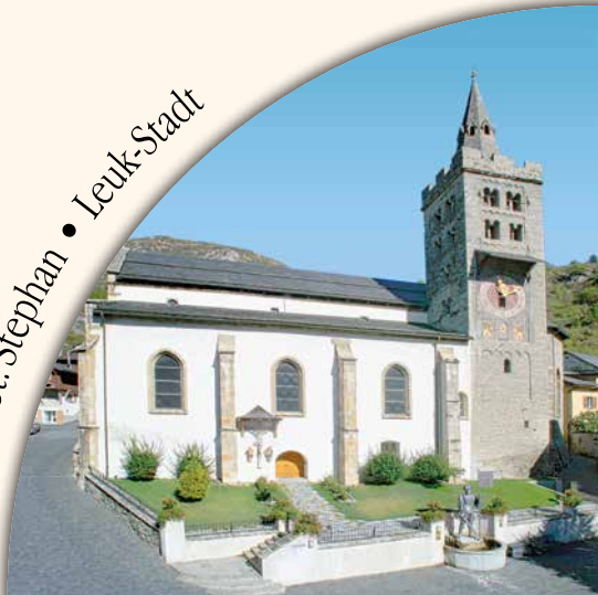
St. Stephan • Leuk-Stadt